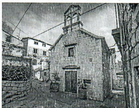
Crva sv. Luke u Velom Varošu